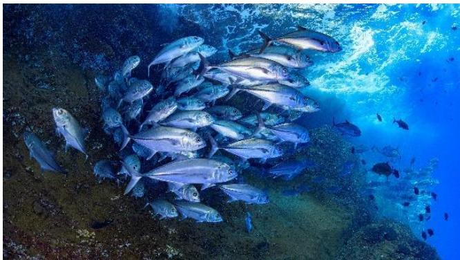
Photo sous-marine d'ambiance prise avec un objectif grand-angulaire (3 photos max)