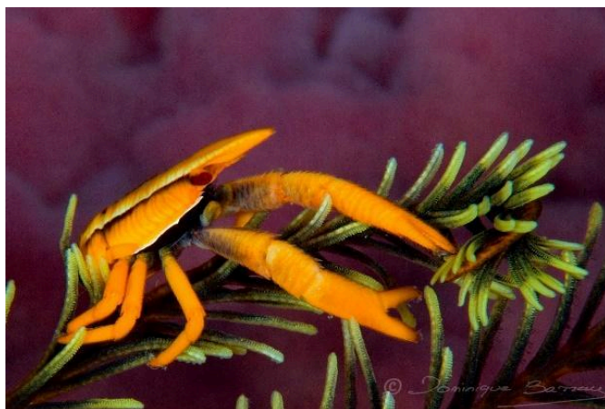
Photo sous-marine en gros plan prise avec un objectif ou dispositif macro (3 photos max)