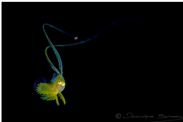
Photo sous-marine prise de nuit en pleine eau et en macro (3 photos max)