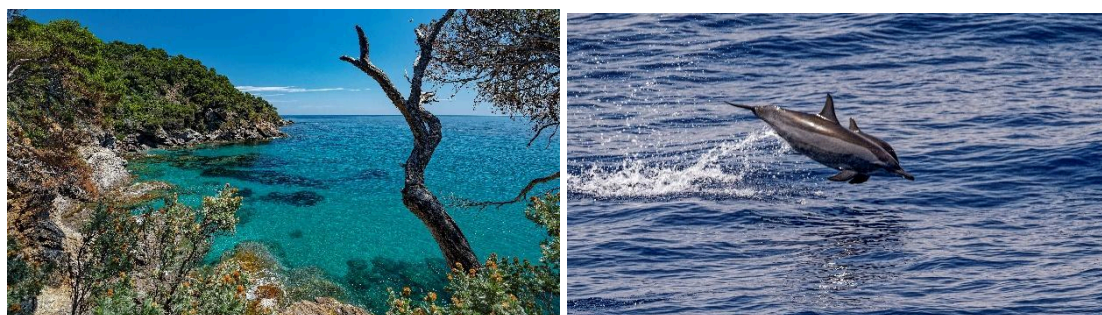
Photo terrestre exclusivement, mise en valeur du monde marin (3 photos max)

Un participant remportant une ou plusieurs catégories dans le concours GALATHEA, n'est pas autorisé à participer l'année suivante dans la ou les mêmes catégories.